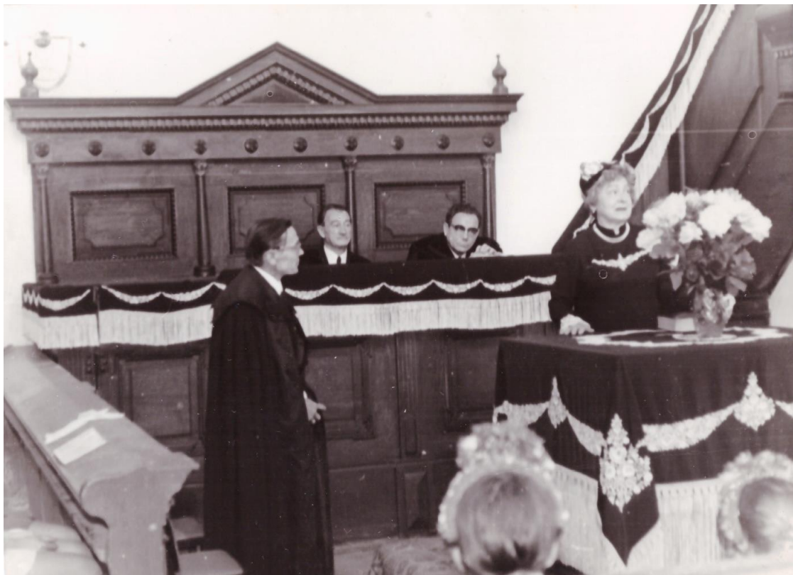
Ünnepi istentisztelet 1975-ben