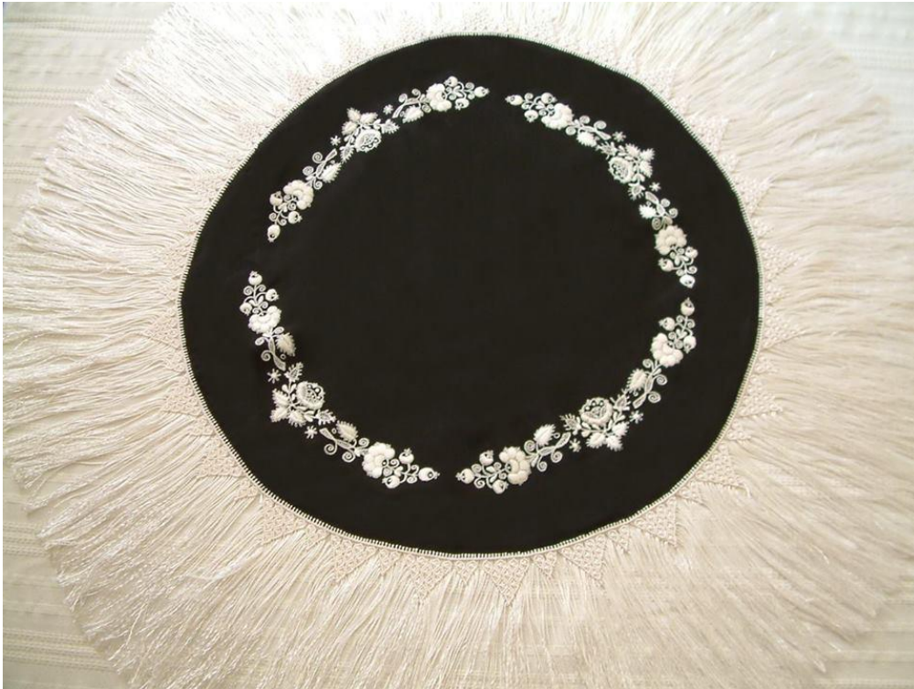
Izsák Kálmánné által 2012-ben készített virágtartói-terítő