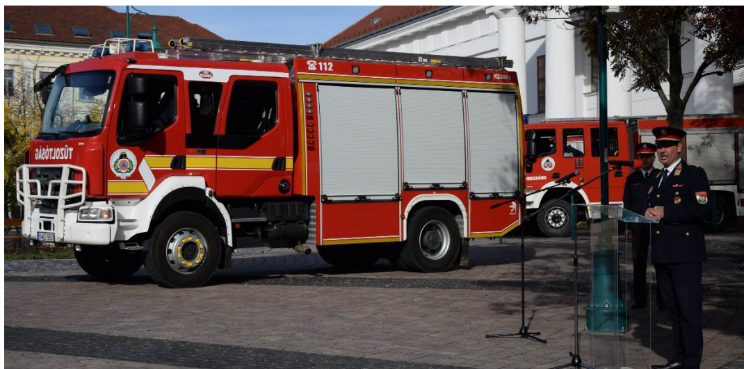
1. sz. kép: Rába gépjárműfecskenő ünnepélyes átadása

Az emlékhely látogathatósága folyamatosan biztosított. Egyre több látogató érkezik az óvodás csoportoktól elkezdve egészen a nyugdíjas korosztályig.